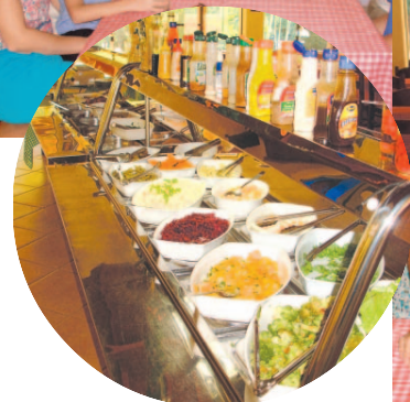
...a variedade no self-service da casa.