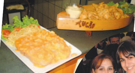
...a deliciosa Bata-ta Recheada com Camarão, e a Porção de Filé de Merlusa.